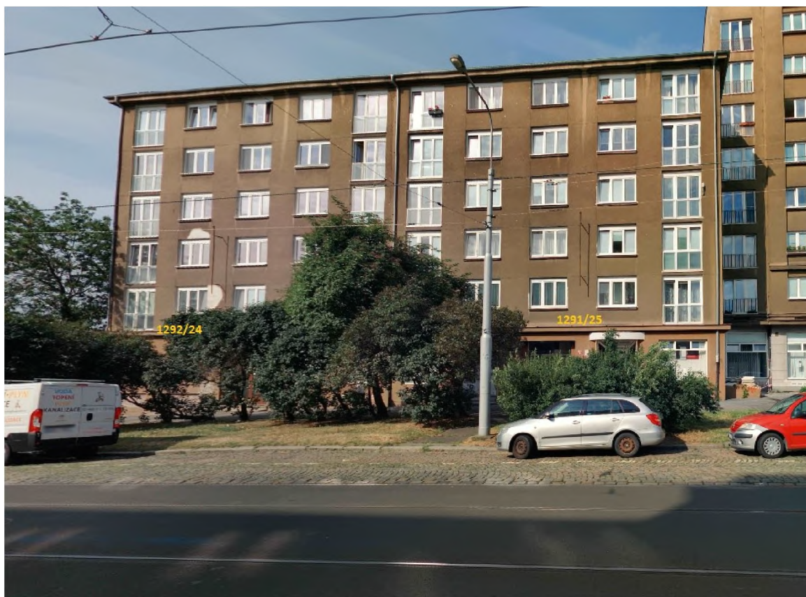
Pohled na dům č. p. 1291 a 1292 z Kubánského náměstí