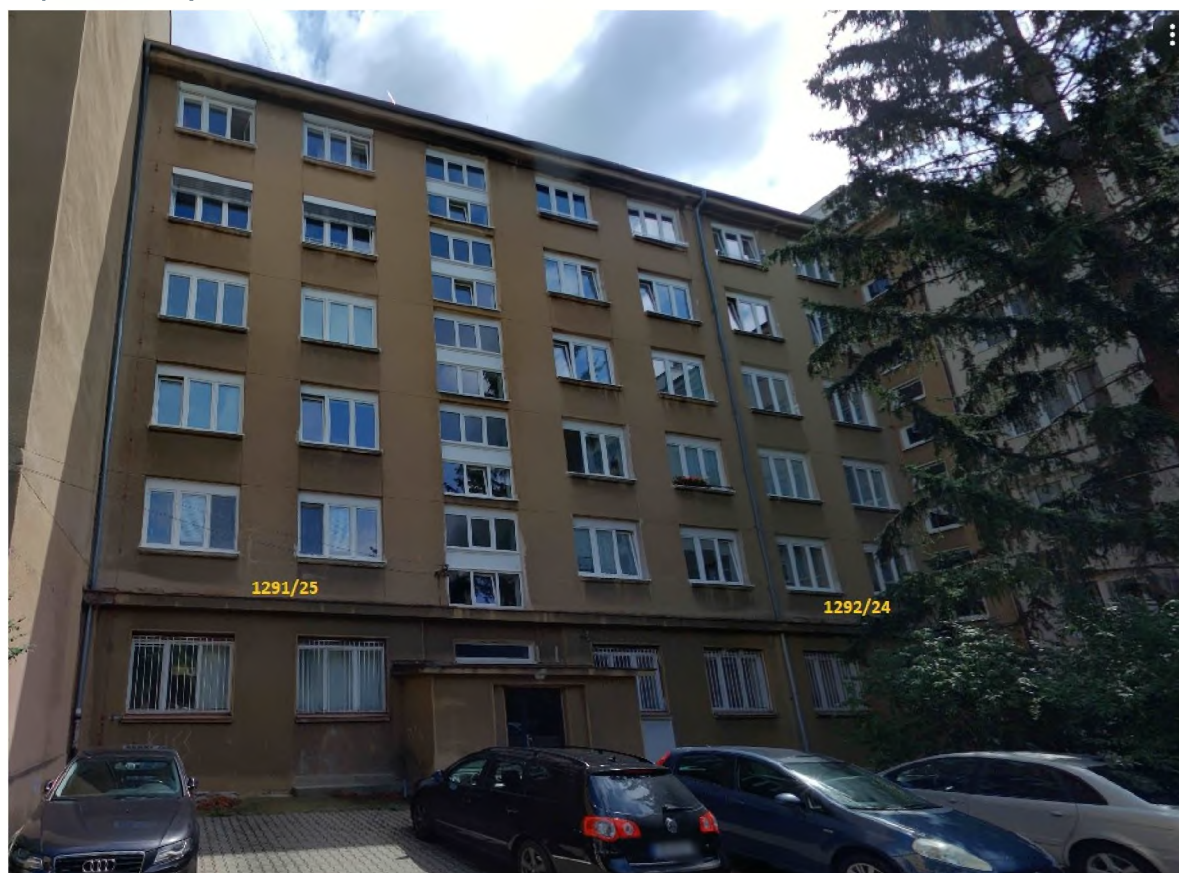
Pohled ze dvora

Po ukončení stavebních prací je nutné odstranění všech dočasných ochranných opatření a je potřeba prostor stavby uklidit.